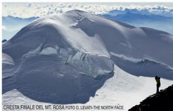
CRESTA FINALE DEL MT. ROSA

Ha ottenuto diversi riconoscimenti alpinistici come il premio Paolo Consiglio per le spedizioni extraeuropee compiute con difficoltà elevate, il premio Cassin per le prime salite in stile alpino effettuate in Patagonia e Pakistan e infine il premio internazionale Saint Vincent Grolla d'Oro 2007 per la prima salita in solitaria della parete sud del Cervino.