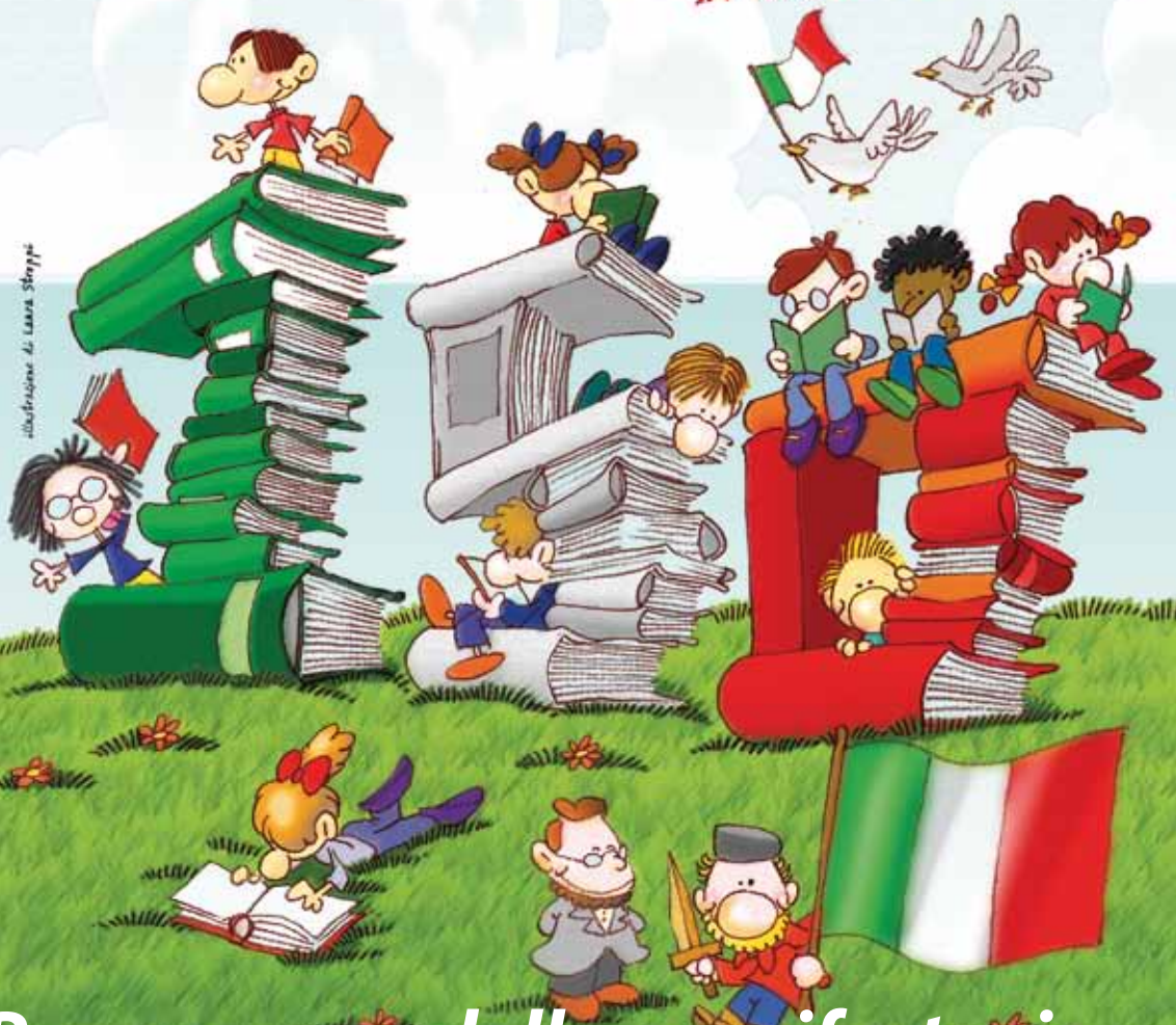
illustrazione di Laura Strappè

Unità d'Italia! 150 anni della nostra storia