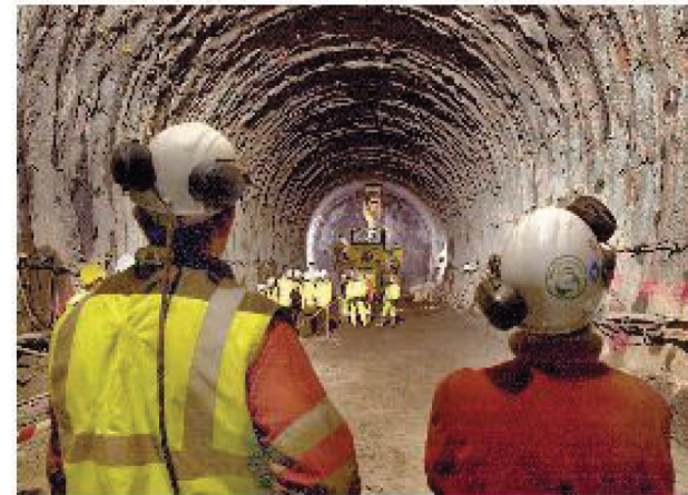
Le prime tappe I parlamentari d'Oltralpe chiedono di ratificare l'accordo con Roma e di lanciare i cantieri preparatori entro il 2013 (Nella foto la discenderia ultimata nel 2005 a Saint-Martin-de-la-Porte)

I senatori francesi chiedono un impegno al governo Ma la Corte dei conti esprime dubbi sull'opera